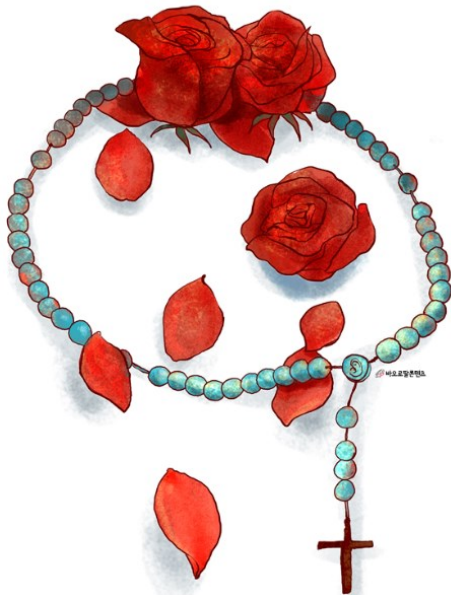
묵주기도는 사랑의 언어입니다. - 복자 야고보 알베리오네

“ 주님이 말씀하신다. 내가 너희를 세상에서 뽑아 세웠으니, 가서 열매를 맺어라.. 너희 열매는 길이 남으리라.”